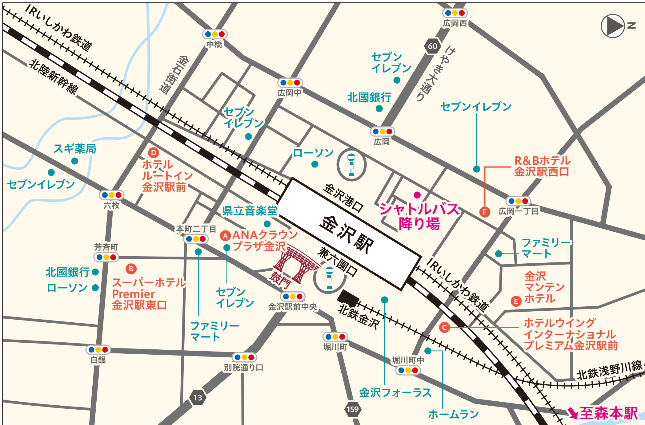
【大会会場】石川県立いしかわ特別支援学校（IRいしかわ鉄道「森本駅」下車）