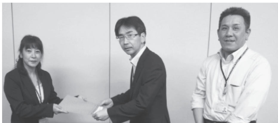
厚生労働省 障害者雇用対策課