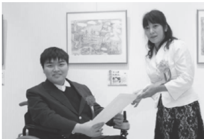
絵画の部 「V vs Z」