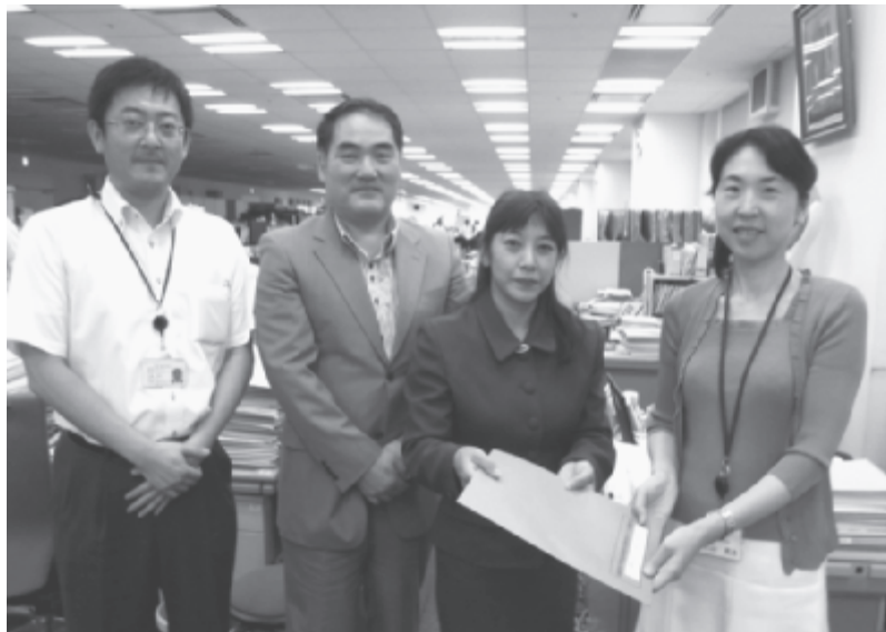
文部科学省特別支援教育課